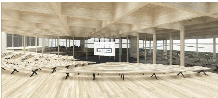
「神山まるごと高専(仮称)」 内観