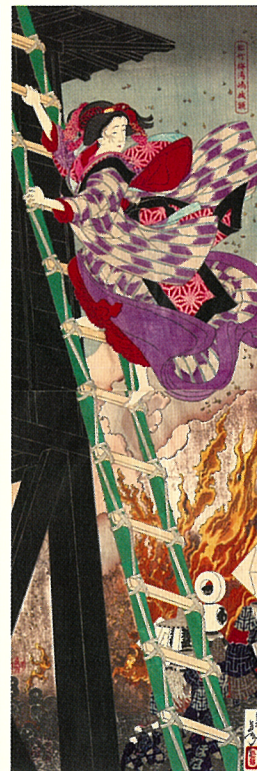
月岡 芳年「松竹梅湯島掛額」 大判錦絵 縦二枚続