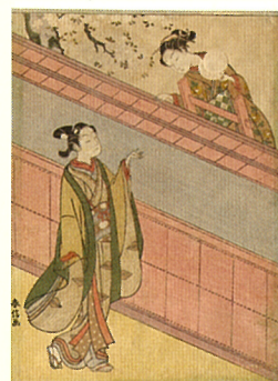
鈴木 春信「鞠と男女」中判錦絵