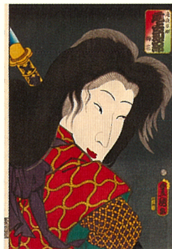
三代 歌川 豊国 「二代目尾上菊次郎 滝夜叉姫」 大判錦絵

千葉市美術館は貴重な浮世絵を数多く所蔵していますが、浮世絵は日光に弱く、展示の環境と期間に制限があります。これらの作品を高精細にデジタル化することにより、実物が持つ質感や凹凸、当時の技巧を、時間や場所を選ばずに、より身近に鑑賞することが可能になりました。また、高精細複製画に映像をプロジェクションし、センサーと組み合わせることで、鑑賞者の動きに反応して絵が生き生きと動き出す「ムービングアート」などの新しい鑑賞体験も可能となりました。千葉市美術館所蔵の貴重なコレクションの数々を、ぜひこの日本橋でお楽しみください。