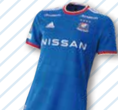
横浜F・マリノスコース