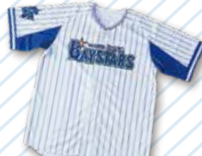
横浜DeNAベイスターズコース