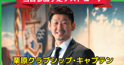
栗原クラブシップ・キャプテン