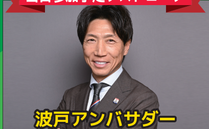
波戸アンバサダー