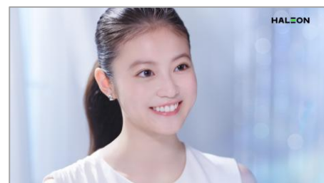
将来のことも考えてくれるんだ