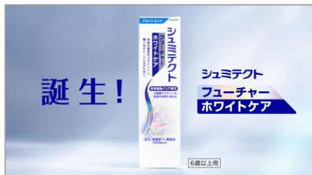
シュミテクト フューチャーホワイトケアは、