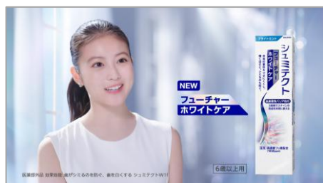
フューチャーホワイトケア