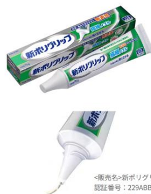
<販売名>新ポリグリップ S a 2 認証番号：229ABBZX00016000 管理医療機器