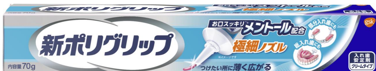
新ポリグリップ 極細ノズル メントール配合

お客様からは、「お口がすっきりしそう」、「爽快なメントールがプラスされているならすぐにでも使いたい」といった声が寄せられています※ 3 。