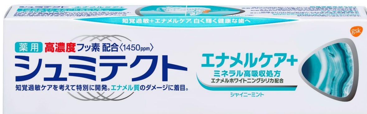
シュミテクト エナメルケア+

「シュミテクト エナメルケア+」は、「シュミテクト」の特徴である知覚過敏症状予防だけでなく、「ミネラル高吸収処方」により、歯のエナメル質を強化、ムシ歯を予防します。「エナメルホワイトニングシリカ(清掃剤)」配合で、歯を自然な白さへ導きます。フレーバーはシャイニーミントで、爽やかな後味が特徴です。