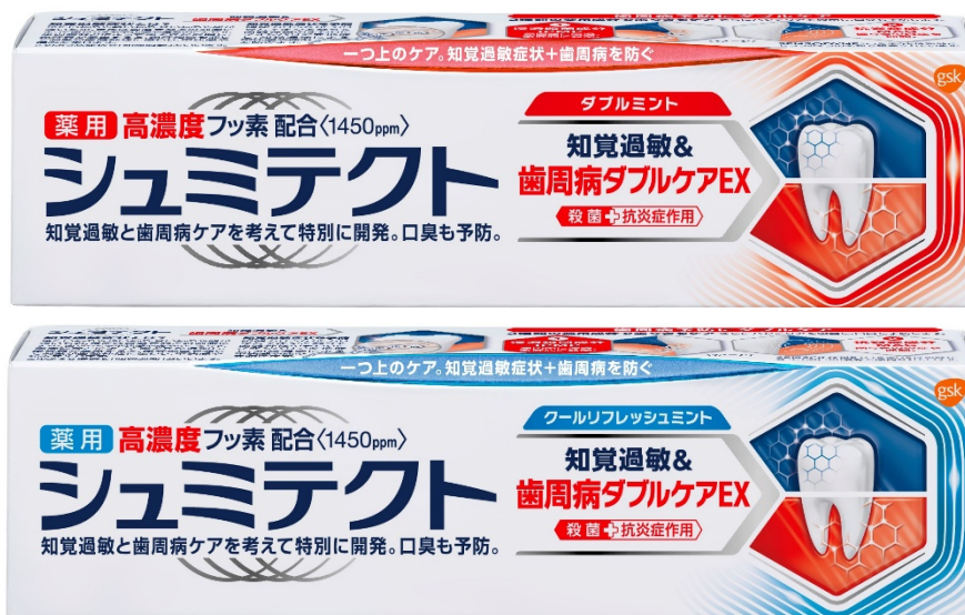
シュミテクト 歯周病ダブルケア EX

「シュミテクト 歯周病ダブルケア EX」は、シュミテクトで初めて殺菌成分を最大濃度(*3)配合しました。知覚過敏症状だけでなく歯周病も同時に徹底ケアすることが可能になります。フレーバーは、さわやかでマイルドな「ダブルミント」と息スッキリ爽やかな「クールリフレッシュミント」の2種類です。