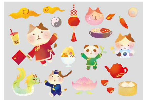
【 イロにゃん China Trip 90131 】