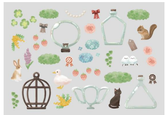
【 テラリウム 90132 】