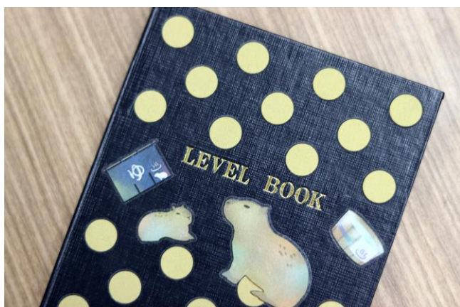
測量野帳 (紙：エキゾチックアニマル&ドット)