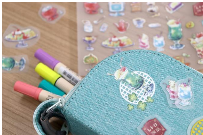
ペンケース (キャンバス地：レトロフェ&パターンドット)