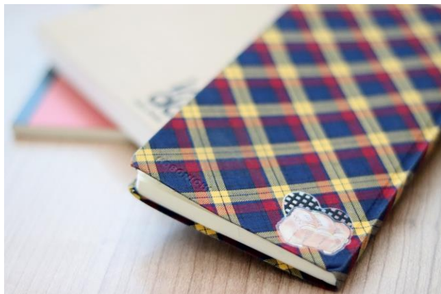
手帳 (キャンバス地：ベ-カリ-&パターンハート)