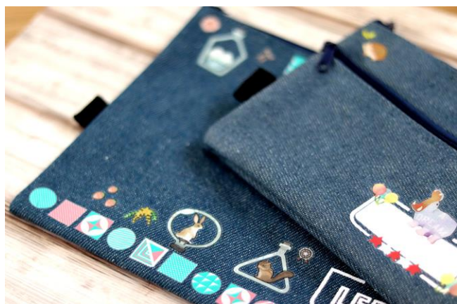
ポーチ (デニム：テリウム&タイル)