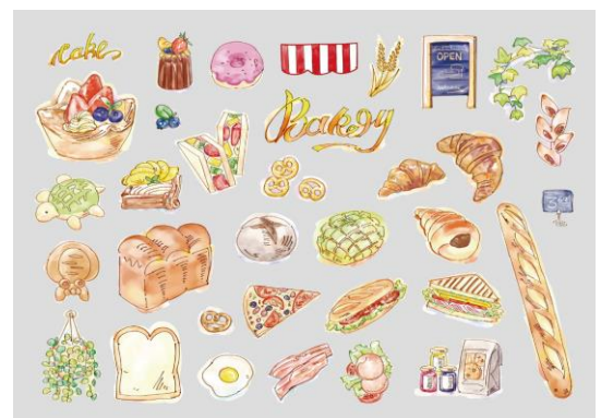
【 ベーカリー 90134 】