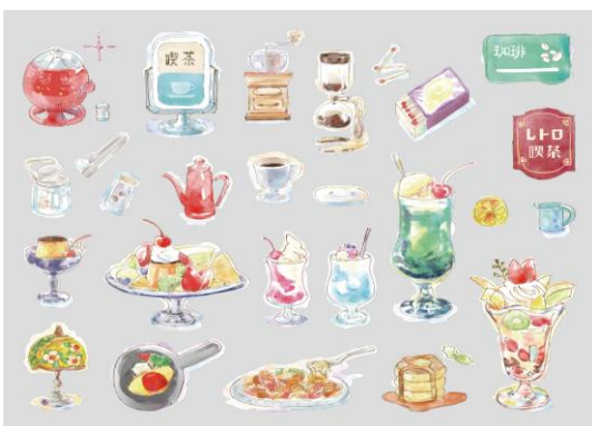
【 レトロカフェ 90133 】