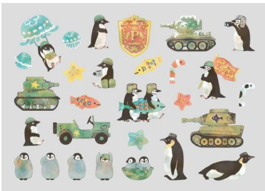
【 タンク ペンギン 90132 】