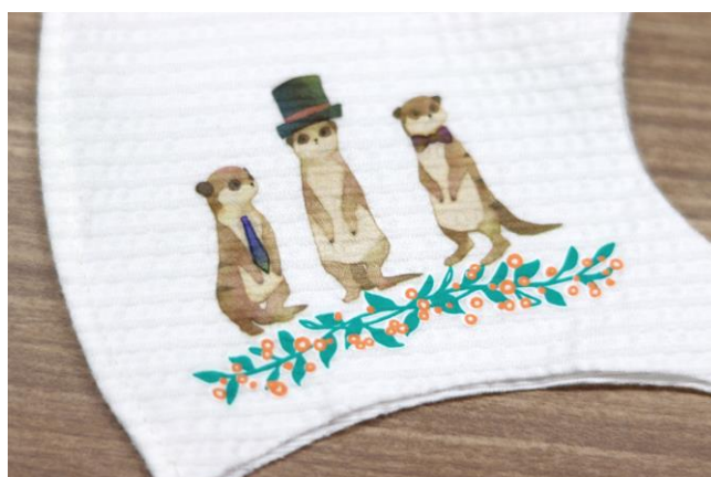
マスク (キュプラ：エキゾチックアニマル&レース)