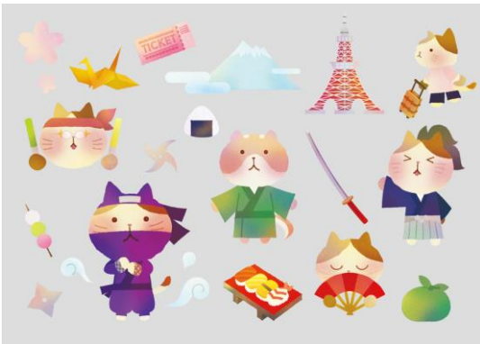
【 イロにゃん Japan Trip 90130 】