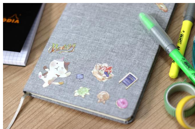
ノート (キャンバス地：ベ-カリ-&イロにゃん)