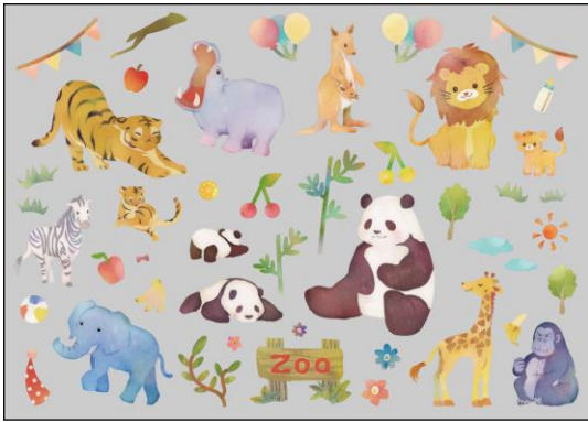
【 アニマル 90128 】