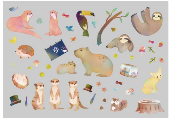
【 エキゾチックアニマル 90129 】