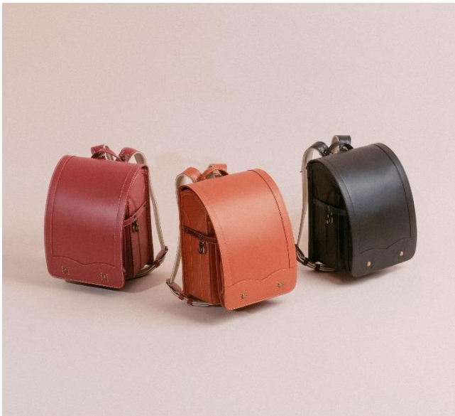
左から、ローズ、キャメル、ブラック