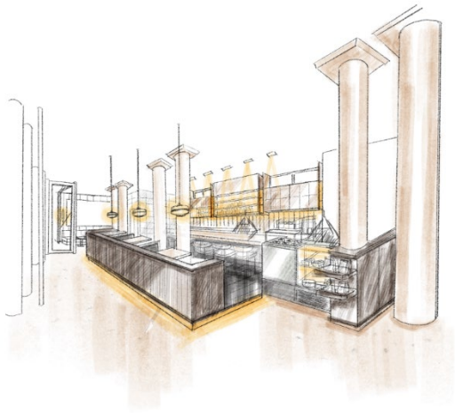
カフェ・バーのイメージイラスト