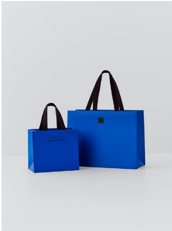
「TABAYA United Arrows」のショッパー

ショッパーやギフトボックス等の各種包材は、「TABAYA United Arrows」で取り扱う商品や販売員の所作の美しさと、手にしたときのお客様の高揚感を一層引き立てるデザイン・仕様を追究して制作しました。ショッパーはエンボスを掛けたような風合いに「TABAYA ブルー」を高い彩度で表現できる紙の銘柄と斤量をセレクト。ショッパーサイズと持ち手のバランスは上質さ、自然な長さを持ちやすさを考慮。正面に折り目の付かない製袋方法にもこだわりました。