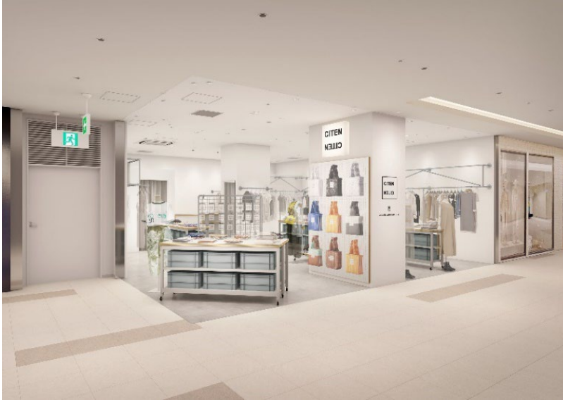
「CITEN ユナイテッドアローズ アミュプラザ博多店」 店舗イメージ