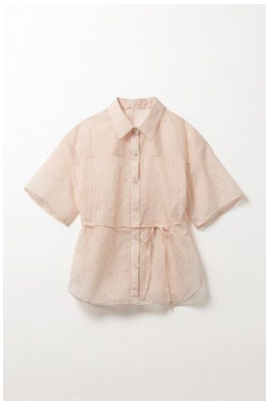
リボンハイウエストシャツ ¥9,900