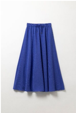
ドライクロスフレアスカート ¥10,890