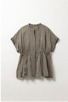
ギャザーハイウエストブラウス ¥9,900