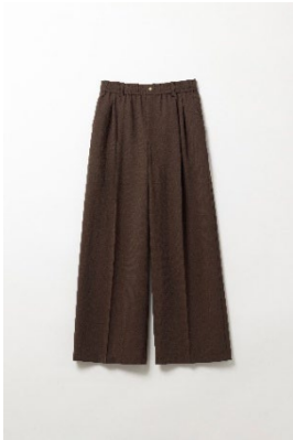
ドライクロスニーハイワイド ¥10,890