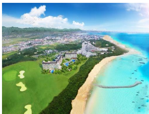
ANA インターコンチネンタル石垣リゾート