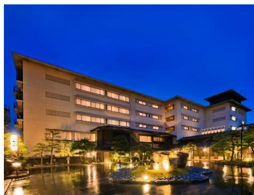
加賀屋別邸 松乃碧