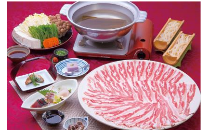
黒豚しゃぶしゃぶ