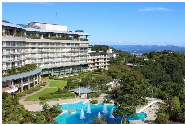
有馬グランドホテル

株式会社 JTB は、2023 年度のサービス最優秀旅館・ホテルとして、JTB 協定旅館ホテル連盟（*1）に加盟の、約 3,600 の旅館とホテルの中から 4 施設を決定しました。