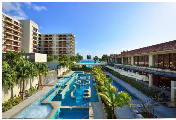
ザ・テラスクラブアットブセナ