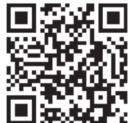
▲見学会受付フォーム

●JTB時刻表100周年サイト： https://jtbpublishing.co.jp/campaign/jtbjikoku100th/