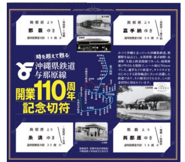
▲記念のクリアファイルと110周年記念硬券を配布