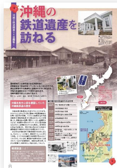
▲JTB 時刻表 12月号 沖縄県鉄道の記事