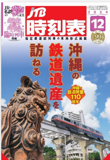
▲JTB 時刻表 12月号の表紙