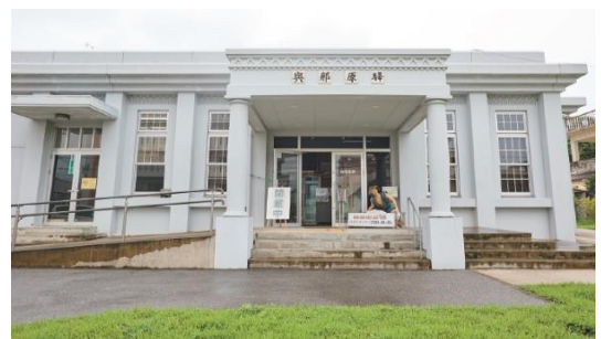
▲ 軽便与那原駅舎展示資料館