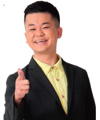
▲沖縄軽便鉄道芸人 首里のすけ

また与那原駅跡地にたつ軽便与那原駅舎展示資料館では、沖縄の軽便鉄道の歴史が貴重な資料と共に展示されるほか、激しい戦火に耐えた遺構として駅舎近くに残る柱の見学会も開催されます。JTB時刻表編集部が制作した110周年記念のオリジナルの硬券やクリアファイルなどのノベルティも配布します。(ノベルティの配布は無くなり次第終了)