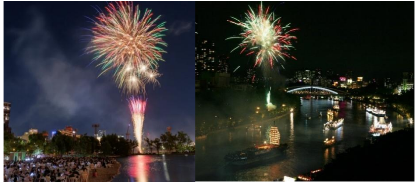
船渡御イメージ