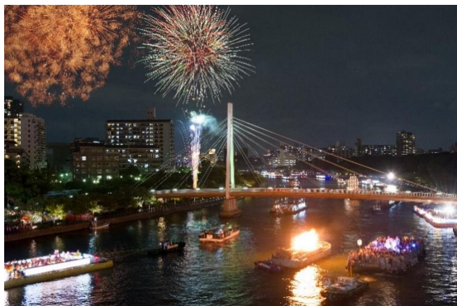
奉納花火イメージ

https://www.jtb.co.jp/kokunai-hotel/list/feature/tenjin_hanabi25/