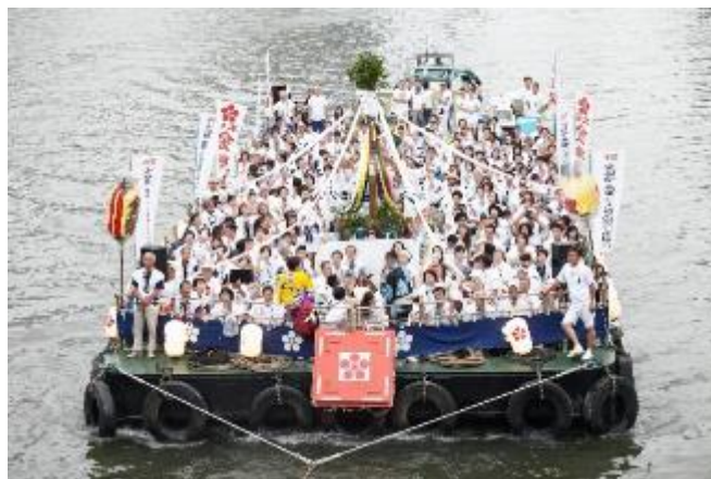
供奉船イメージ