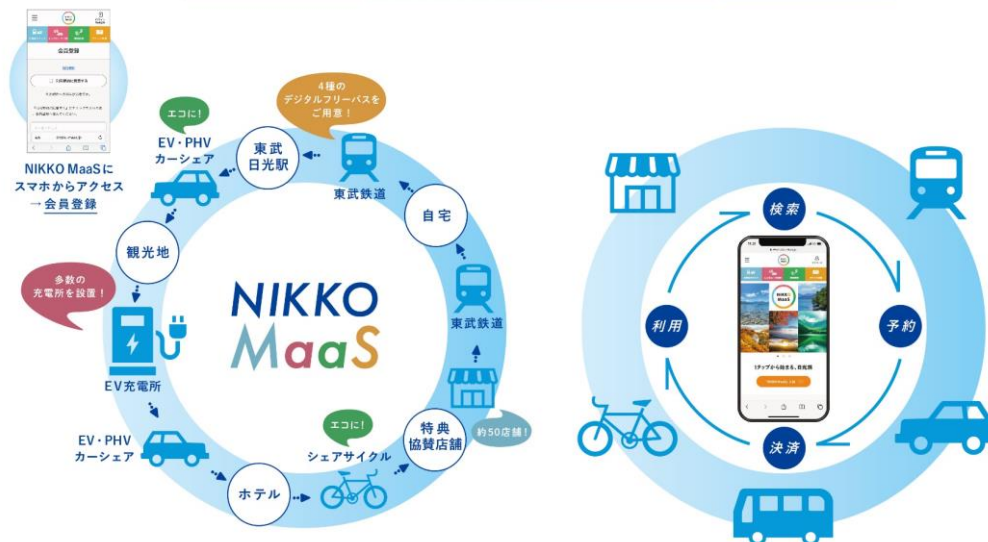
▲NIKKO MaaSでワンストップに「お得・便利・エコ」な日光観光（イメージ）