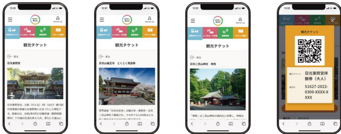
▲「NIKKO MaaS」観光チケット（イメージ）