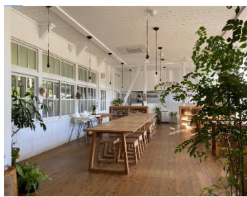
↑ノルディスクビレッジゴトウ レストラン