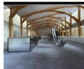
↑五島つばき蒸溜所