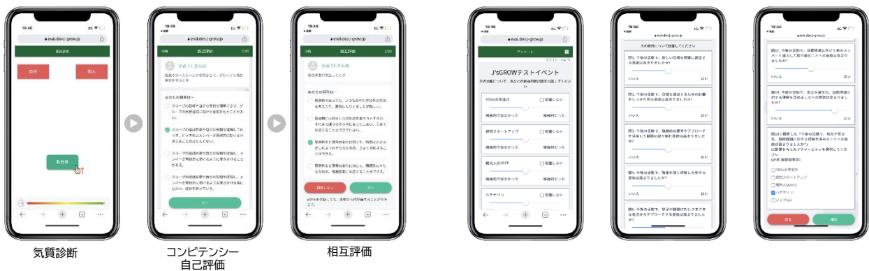
<③事後アンケート 受験画面(イメージ)>

(※)事後アンケートには、学校独自の質問も任意で追加することができます(最大3問)