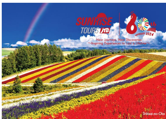
四季彩の丘(北海道美瑛町) ※イメージ