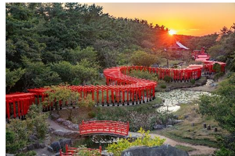
高山稲荷神社 ※イメージ

本ルートは、東北最大の都市である仙台を旅の起点とし、平泉、盛岡、角館、青森、弘前と北上しながら巡るルートです。東北エリアは各地に魅力的なコンテンツがあるものの、二次交通の課題により、外国人観光客にとっては周ることが難しいエリアとなっていました。本ルートではそれぞれの魅力を行程に組み込むことで、その課題を解決し、新たな人流を創出します。