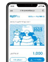
スマホ画面表示イメージ