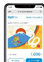
スマホ画面表示イメージ