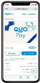
スマホ画面表示イメージ