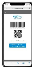
『QUOカードPay』ロゴマーク