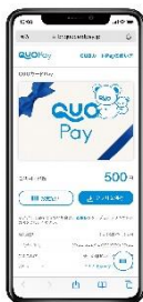
スマホ画面表示イメージ