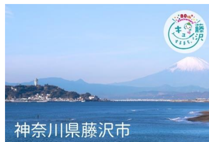
藤沢市デザイン「江の島と富士山」