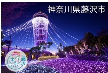
藤沢市デザイン「湘南の宝石」