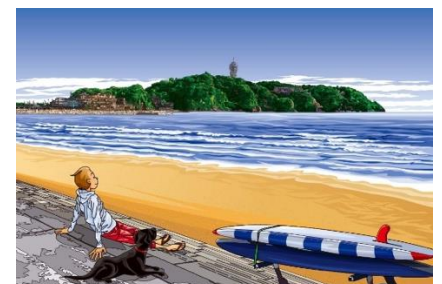
ジュジュタケシ氏デザイン「西の浜のひととき」

「神奈川県ご当地QUOカードPay」は、江の島にある「湘南の宝石」などが使われた藤沢市デザイン2種と、イラストレーターのジュジュタケシ氏が湘南の海を眺めるひと時を描いたデザイン1種を用意しました。購入された「ご当地QUOカードPay」の売り上げの一部は、各地域へ寄付される仕組みとなっており、藤沢市デザインのQUOカードPayは「藤沢市環境基金」( https://www.city.fujisawa.kanagawa.jp/kankyou-s/machizukuri/kankyo/hojo/kikin.html )に、ジュジュタケシ氏デザインのQUOカードPayは「公益財団法人かながわ海岸美化財団」( https://www.bikazaidan.or.jp/ )へ寄付されます。