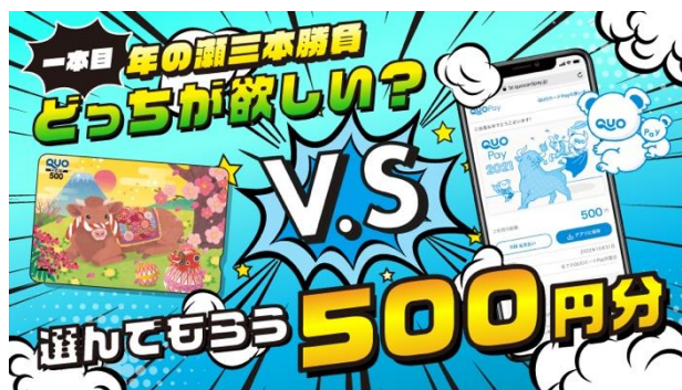
第2弾「QUOカード vs QUOカードPay リベンジマッチ！年の瀬三本勝負キャンペーン」