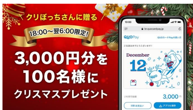
第1弾「クオとペイからクリスマスプレゼント！キャンペーン」

全国共通のプリペイドカード「QUOカード」を発行している株式会社クオカード(以下当社、本社：東京都中央区、代表取締役社長：近田 剛)が展開するスマートフォンで使えるデジタルギフト『QUOカードPay(クオ・カード ペイ)』は、2020年12月24日(木)～2021年1月10日(日)の期間中、総額約150万円分のQUOカードPayが抽選で30,520名※に当たる4種のTwitterキャンペーンを実施します。※総額「約150万円分」と当選者数合計「30,520名」にはキャンペーン第2弾「QUOカード vs QUOカードPay」リベンジマッチ！年の瀬三本勝負」キャンペーンのQUOカードの当選金額と当選者数は含まれていません。