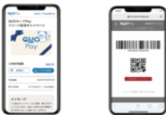
スマホ画面表示イメージ