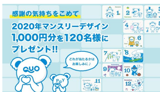
第4弾「2020年マンスリーデザイン QUOカードPay プレゼントキャンペーン」