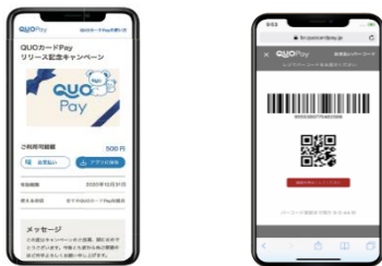
スマホ画面表示イメージ