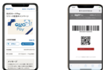
スマホ画面表示イメージ