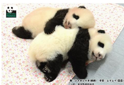
シャオシャオ&レイレイ②(68日齢)