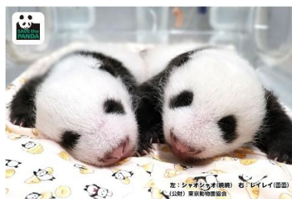
シャオシャオ&レイレイ①(38日齢)