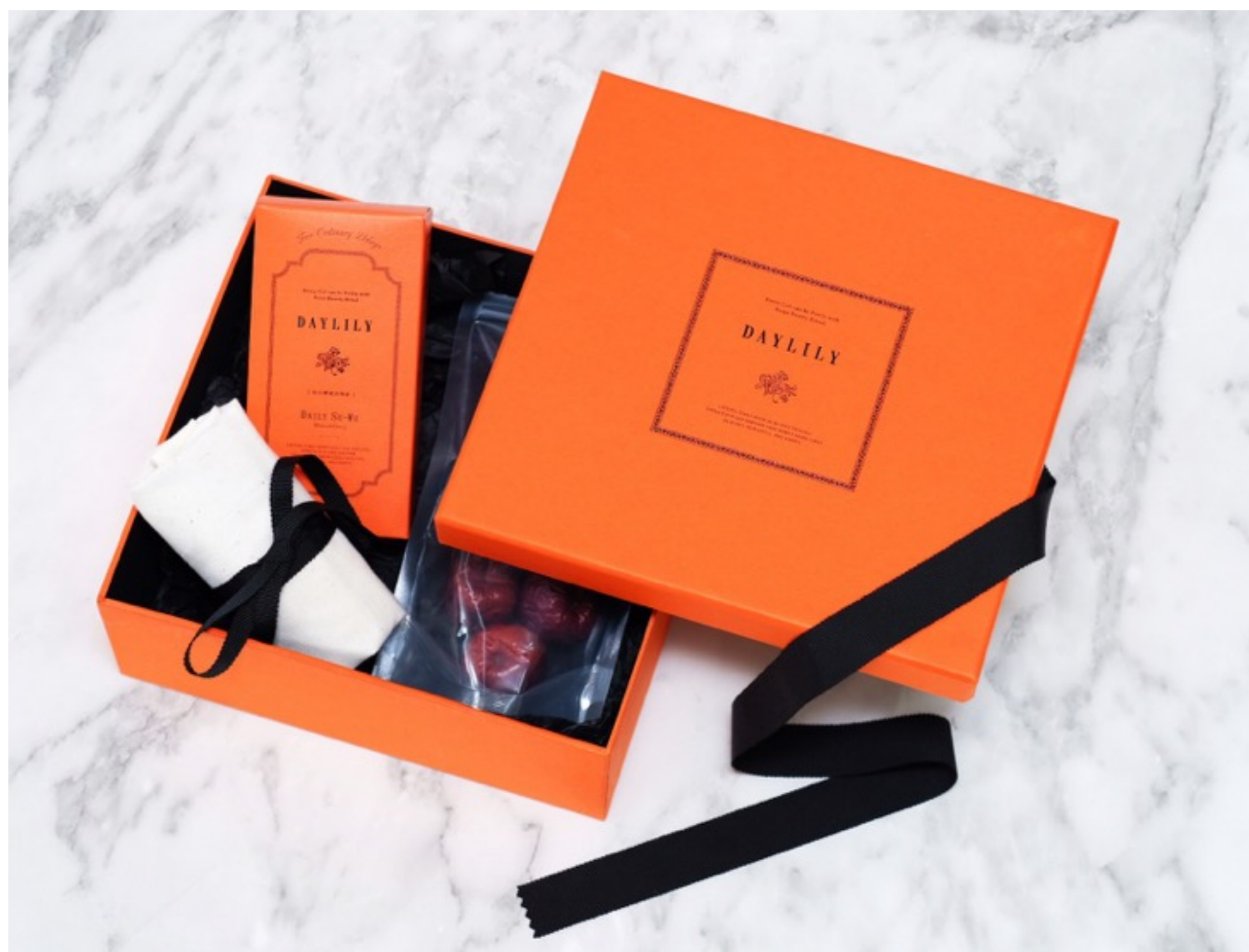
「オープン記念BOX」 (1000台湾元) 台湾の美容漢方ドリンク四物飲・ナツメ・トートバック・ギフトBOX