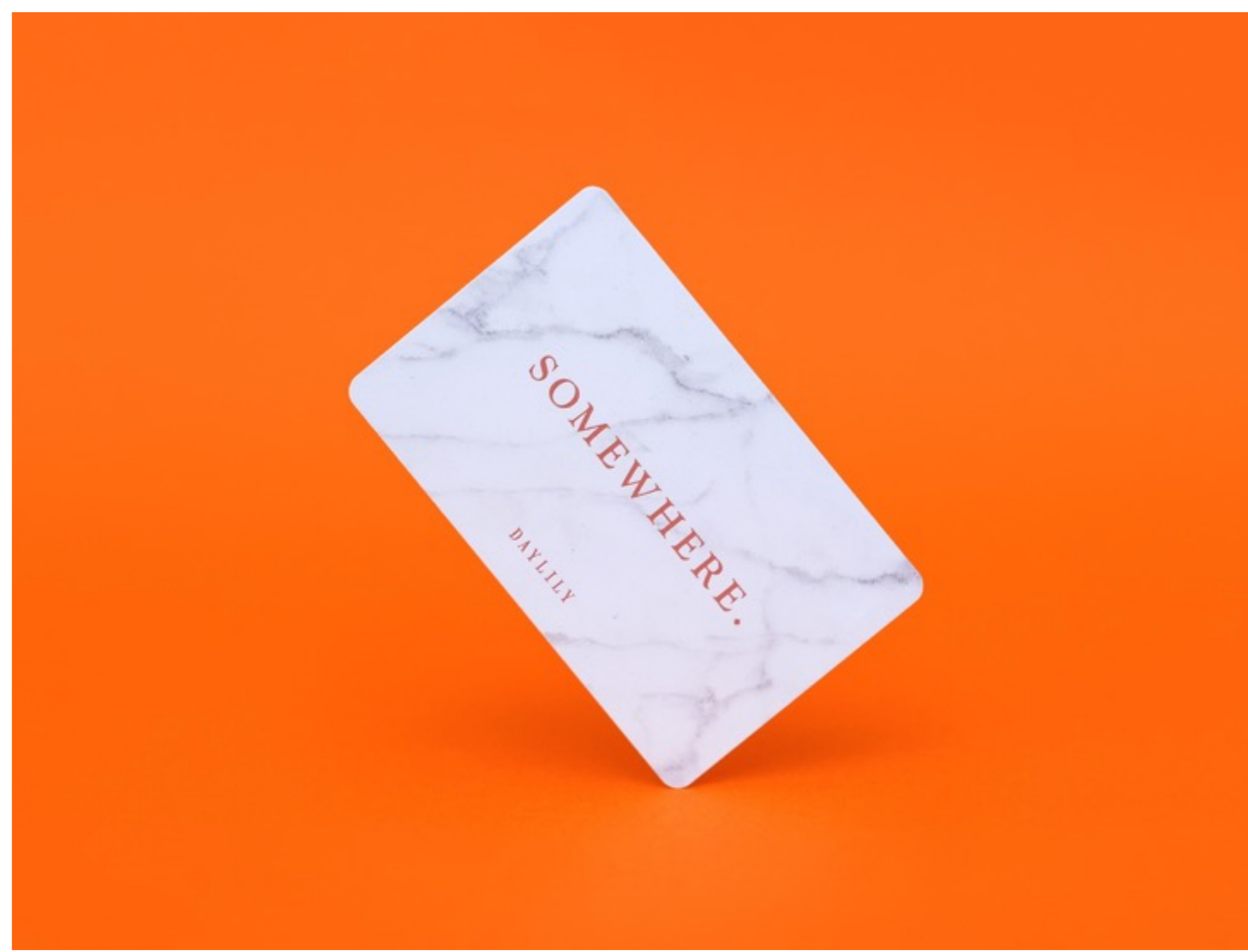
DAYLILYオリジナル「悠遊卡」 (380台湾元) 台湾旅行に欠かせない交通ICカード