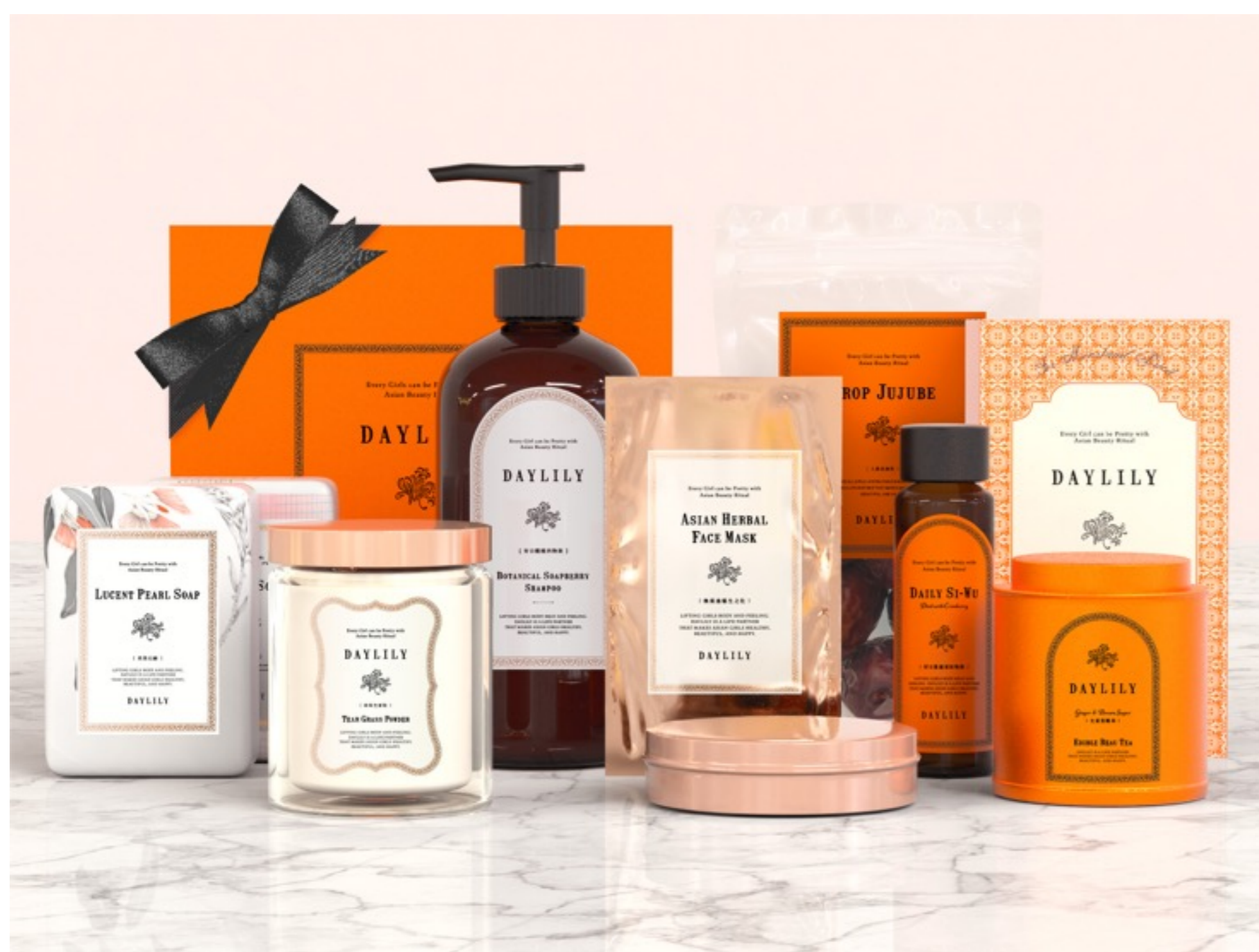
グランドオープン (4/1) 後の商品ラインナップ 真珠粉の石鹸やクコの実のフェイスマスク、食べられる薬膳茶等