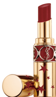
N°92 ROUGE CAFTAN ルージュ カフタン [NEW] 小悪魔キスのモテローズ