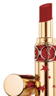
N°102 READY TO SEDUCE レディトゥセデュース [NEW] キスで誘惑するダスティレッド