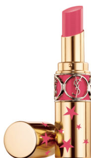
N°49 ROSE SAINT GERMAIN ローズ サンジェルマン 恋愛成就のファッションニスタピンク