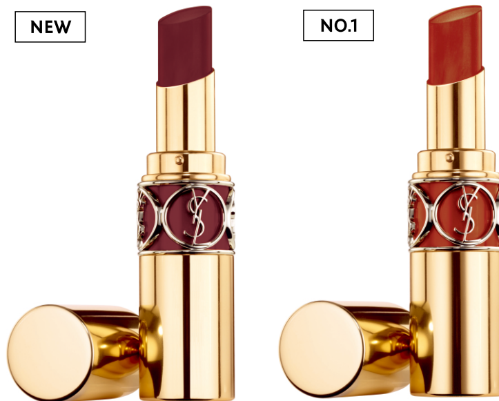
N°76 RED IN THE DARK レッド イン ザ ダーク スタイリッシュなモーヴブラウン 2020年4月3日(金)全国発売