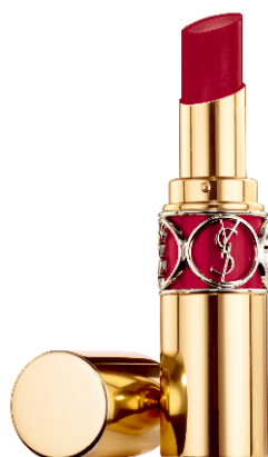
N°92 ROUGE CAFTAN ルージュカフタン 小悪魔キスのモテローズ