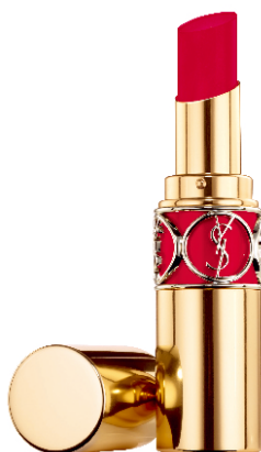
N°101 MAKE IT BURN メイキットバーン 危険なまでに魅了するピュアレッド