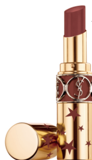
N°76 RED IN THE DARK レッド イン ザ ダーク [NEW] スタイリッシュなモーヴブラウン