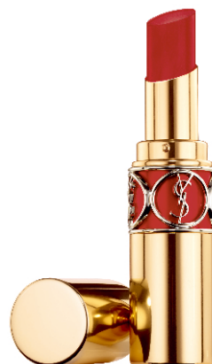
N°102 READY TO SEDUCE レディトゥセデュース キスで誘惑するダスティレッド