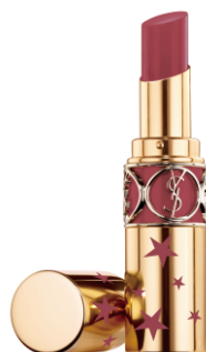
N°91 NUDE AVANT-GARDE ヌード アヴァンギャルド [NEW] とろけるキスのローゼーヌード