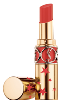
N°12 CORAIL DOLMAN コライユ ドルマン 小悪魔アブリコットレッド

人気2色と、NEXT IT BROWNを含む新5色が限定コレクターとして新登場!