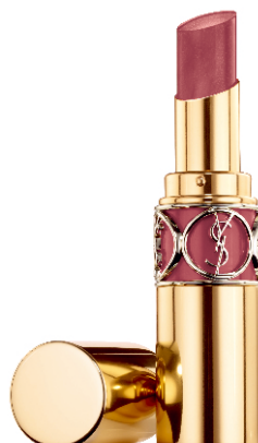
N°91 NUDE AVANT-GARDE ヌードアヴァンギャルド とろけるキスのローズヌード