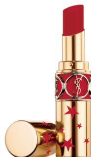
N°101 MAKE IT BURN メイキットバーン [NEW] 危険なまでに魅了するピュアレッド