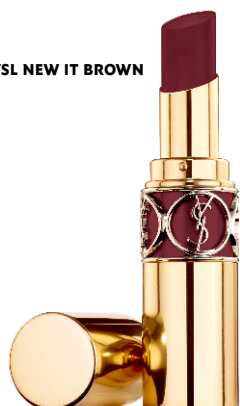
N°76 RED IN THE DARK レッドインザダーク スタイリッシュなモーヴブラウン