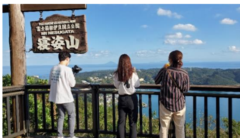
①下田の街が一望できる寝姿山