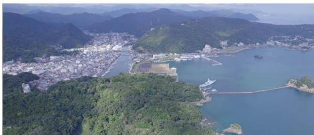
▼ドローンによる撮影素材例①