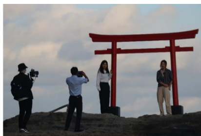
④2400年の歴史を持つ「白浜神社」