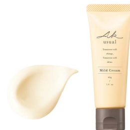
薬用u クリーム 40g [クリーム]