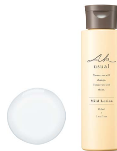
薬用u ローション 150mL 【化粧水】

*1 ウマスフィンゴ脂質(皮フ保護成分) *3 すべての方に肌トラブルが起こらないということではありません。