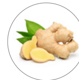
ショウガ根エキス*6