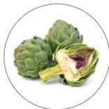
アーチチョーク葉エキス*6