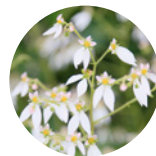
ユキノシタエキス*6