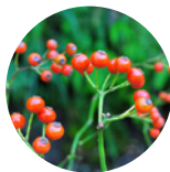
ノイバラ果実エキス*6

植物由来の美容成分*4配合で、肌のキメを整え、毛穴の目立たないつるすべ肌*7へ。