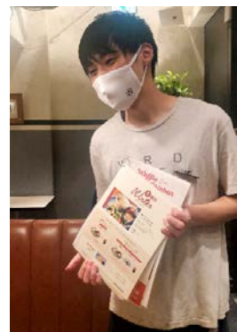
写真) 制菌加工マスクを着用して接客の様子

今回の取り組みでは、「MIZICA PROJECT」を推進するモリリンが手掛けるBIO SHIELD制菌加工、さらには非フッ素撥水「bluelogy®」加工を活用し、カフェ・カンパニー直営の「WIRED CAFE」で接客するスタッフを対象に、ロゴ入りの制菌加工マスクの着用を開始します。「WIRED CAFE」を運営するカフェ・カンパニーでは、着用開始の際に店舗スタッフに制菌加工マスクについて説明することで、改めて店舗の衛生管理に対する意識づけを図る機会になると考えています。また、各店舗では「人と人の感性・共感コミュニティを創造する」というフィロソフィーの下、スタッフとのコミュニケーションを通じてお客さまにも衛生管理について、今一度考えていただく機会になることを期待しています。