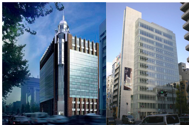
相互館110タワー(左)と京橋創生館(右)

今後も、多様化するお客様のニーズに的確にお応えしながら、ブライダル業界になかった新たな価値を創造するため、独自の取り組みを積極的に行ってまいります。