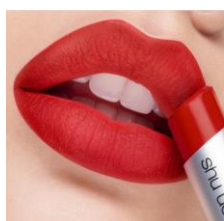
シックな装いにぴったり マットリップ 『ルージュ アンリミテッド マット M RD 163』