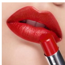
カジュアルでも使いやすい サテンリップ 『ルージュ アンリミテッド RD 163』