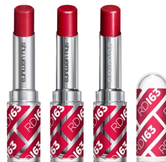
左から『ルージュ アンリミテッド マット M RD 163』、 『ルージュ アンリミテッド RD 163』 『ルージュ アンリミテッド ラッカーシャイン LS RD 163』 (すべて限定パッケージ) 2019 年 1 月 1 日(火)限定発売 各 3,200 円(税抜)

植村秀が長年追い求めてきたアジア人女性のために開発された赤リップ“RD 163”。シュウ ウエムラはアジア人女性約 3000 人以上の肌を研究し、アジア人の肌を明るく魅せる絶妙なバランスの色味を開発。そこにアーティストの感性を融合させ生まれたのが、流行に左右されず普遍的、そしてアジア人を美しく魅せる究極*の赤。つけた瞬間、肌に馴染み、あらゆる肌色をもつアジア人女性に似合うこと間違いなし。肌を美しく際立たせ、一瞬にしてあなたの表情を輝かせます。サテンタイプの『ルージュ アンリミテッド』、ベルベットの質感の『ルージュ アンリミテッド マット』、そして光を放つ鮮烈ルージュ、新テクスチャーの『ルージュ アンリミテッド ラッカーシャイン』の3テクスチャーのラインナップ。ファッションやスタイル、気分に合わせて質感を変えて楽しむことができます。またブランドのアイコンックカラーとなる RD 163 の誕生を記念して、ロゴがあしらわれた限定パッケージも登場。さあ、あなたはどの RD 163 を選ぶ？