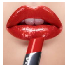
主役級の輝きを誇る ラッカーシャイン 『ルージュ アンリミテッド ラッカーシャイン LS RD 163』