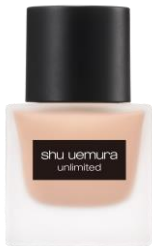
『アンリミテッド ラステイング フルイド』 全 24 色 各 5,400 円(税抜)