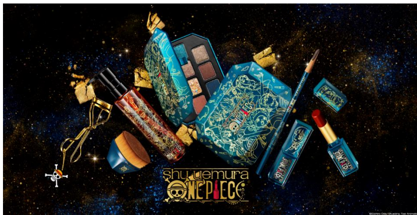
「シュウ ウェムラ×ワンピース コレクション」

大胆になればなるほど、あなたの魅力は懸賞金トップレベル。 冒険心くすぐるカラーを纏えば、最強のメイクアップパイレーツに。