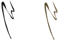
サウンド ブラック ダーク ブラウン