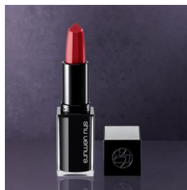
ルージュ アンリミテッド キヌ サテン