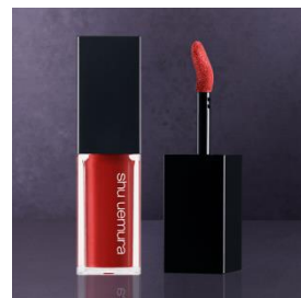
ルージュ アンリミテッド キヌ クリーム