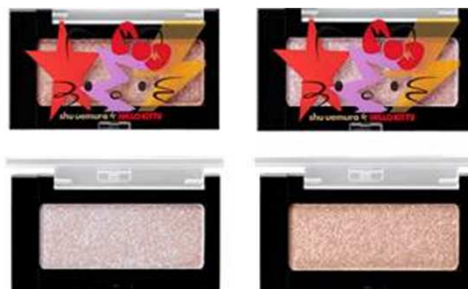
〈限定色〉クリスタルミラーージュ

アプリ要らず。ワンストロークで輝きフィルターをオンするマルチハイライター。ウェットなツヤ感を演出するクリスタルミラーージュ パウダー効果で、自分だけのスポットライトを。