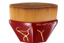
ペタル55 ファンデーション ブラシ 1種 6,600円(税込)