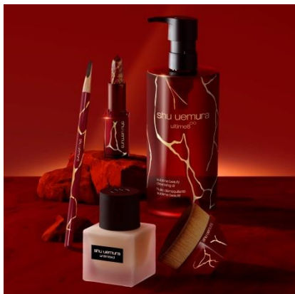
アルティム8 ∞ スプリム ビューティ クレンジング オイル 450mL 1種 12,650円(税込)

新年を祝し、シュウ ウェムラを代表する3つのアイコンアイテムが 華麗なルージュ アンリミテッド ラッシュ ラヴァ レッド コレクションのデザインで登場。