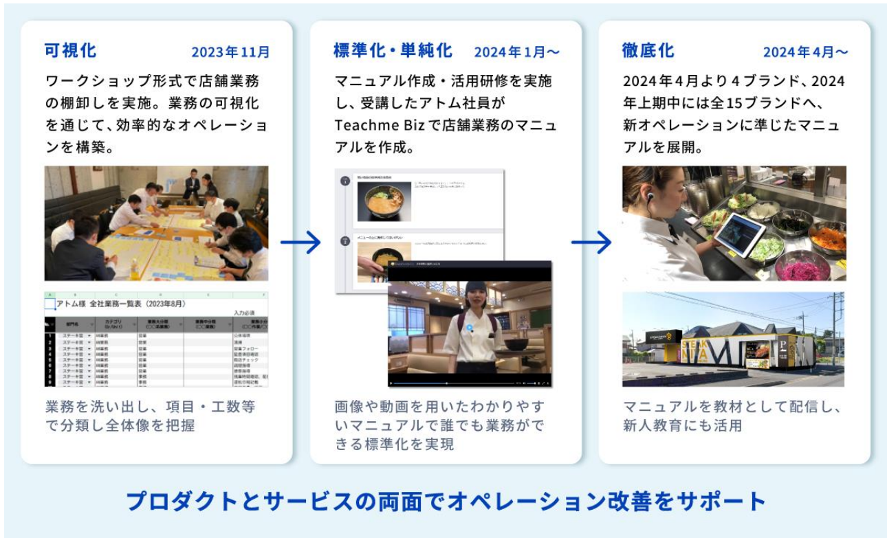
アトムでの取り組みの全体像

アトムとスタディストは業務の可視化、標準化・単純化、徹底化の各ステップにおいて業務の棚卸しから人材の育成、マニュアルの電子化まで幅広く取り組んでまいります。効率的なオペレーションを構築することで、従業員の働きやすい環境を整備、お客様に向き合う時間を捻出すると同時に、各業態の共通業務に関しては手順を統一することで、アトムとしての一体感醸成や業態を超えた業務効率化を実現します。