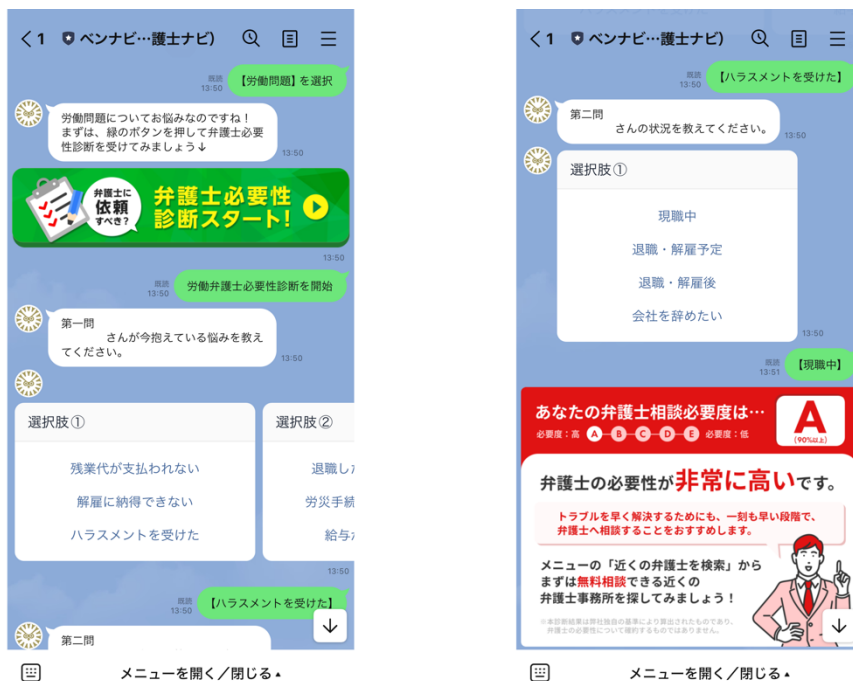
「ベンナビ」LINE公式アカウント 利用画面

「ベンナビ」では、ポータルサイト上で弁護士情報や法律トラブルに関するコラムを発信していますが、ユーザーが日ごろ接する機会が多いチャンネルでも情報をお届けすべく、2021年9月にLINE公式アカウントを開設しました。