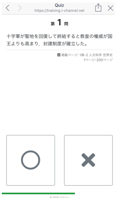
一問一答の練習問題イメージ