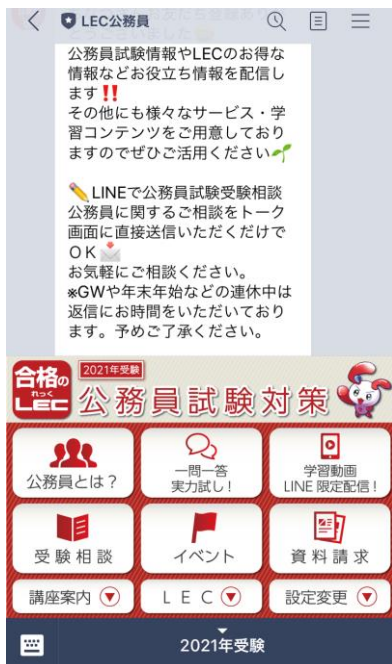
LINE公式アカウント「LEC公務員」メニュー画面

メニューの「公務員とは?」を選択すると、公務員の仕事内容や公務員試験の内容等に関するガイダンス動画を視聴できます。