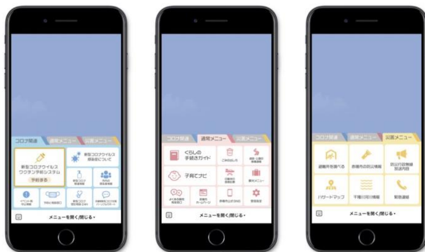
▲「赤穂市公式LINEアカウント」メニューイメージ

新型コロナウイルスのメニューでは、情報の発信や掲載を行い、赤穂市公式アカウントを友達登録した方はLINEからワクチン接種の予約も可能にしました。ワクチン予約の項目を追加した際には、住民のニーズに対しリアルタイムで応えていくためにメニューを修正したことで、登録者が1万人以上増加しました。