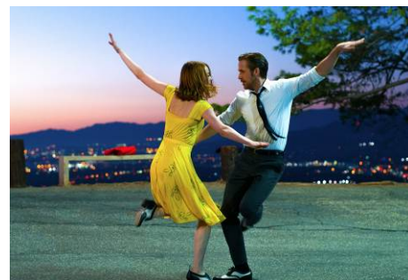
日本でも大ヒット！ エマ・ストーン&ライアン・ゴズリング共演ミュージカル 『ラ・ラ・ランド』