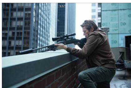
Motion Picture Artwork

キアヌ・リーヴスを主演に迎えたノンストップ・アクション。マフィアにすべてを奪われた元殺し屋が、復讐を誓い、封印した殺人術を解き放ってゆく。