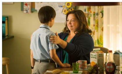
© 2014 St. V Films 2013 LLC. All Rights Reserved.

ビル・マーレイ主演のハートウォーミング・コメディ。偏屈な不良オヤジとイジめられっ子の少年が、奇妙な絆で結ばれてゆく様を描く。