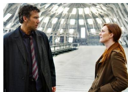
A UNIVERSAL PICTURE © 2006 UNIVERSAL STUDIOS

出演:クライヴ・オーウェン/ジュリアン・ムーア/キウエテル・イジョフォー 繁殖能力を失った人類の未来を背負う少女をめぐる、激しい争奪戦が繰り広げられるSFサスペンス。出演はC・オーウェン、J・ムーア。