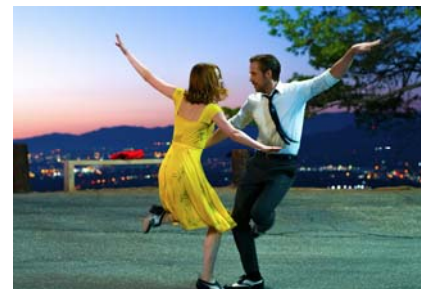
© 2017 Summit Entertainment, LLC. All Rights Reserved. Photo credit: EW0001: Sebastian (Ryan Gosling) and Mia (Emma Stone) in LA LA LAND. Photo courtesy of Lionsgate.

★第89回 監督賞(デイミアン・チャゼル)/主演女優賞(エマ・ストーン)/ 美術賞/作曲賞/歌曲賞/撮影賞受賞★