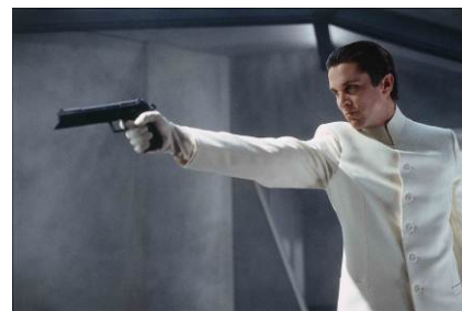
© 2002 Miramax, LLC. All Rights Reserved.

個人の感情が管理された未来で、感情に目覚めた1人の男が国家に挑む戦いをダイナミックかつスタイリッシュに描く。