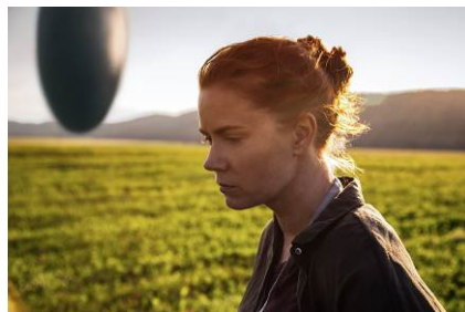
© 2016 Xenolinguistics, LLC. All Rights Reserved.

謎の知的生命体と意思の疎通を図ろうとする言語学者の姿と、 “彼ら”からのメッセージを描く。