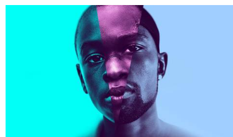
長編2作目にして作品賞を受賞！ 彗星のごとく現れた新鋭バリー・ジェンキンス監督作 『ムーンライト』

さらに、今年のアカデミー賞を楽しむためのガイドとして、「映画館へ行こう2月号」では、アカデミー賞ノミネート作品の情報なども取り上げ紹介します。映画専門チャンネルならではの多彩なラインアップで、91回目を迎える映画界最大の祭典をお楽しみください。